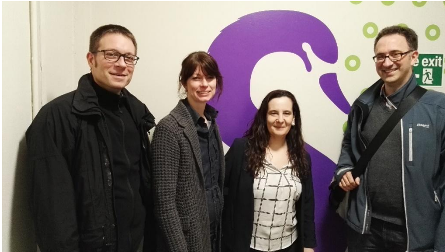
Swan Training Institute

Vom 13.03.17 – 16.03.17 waren drei Lehrer der BBS I Lüneburg, Georg-Sonnin-Schule (BBS II) und BBS Winsen in Dublin um Partnerschaften und neue Praktikumsmöglichkeiten für unsere Schüler anzubahnen. Und das mit Erfolg!